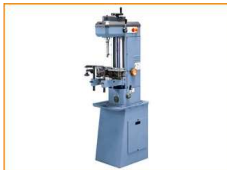
LEV125- Máquina Levigar Cilindros de Veículos Ligeiros e Motos