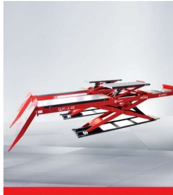
QJY-J-45 Low profile scissor alignment lift