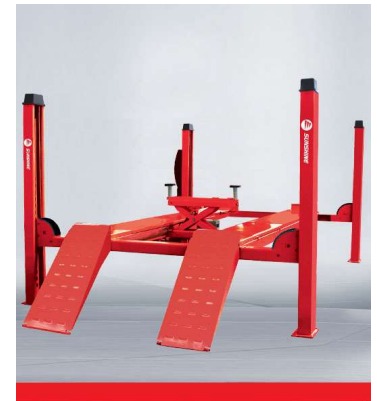
SXJS5019B four-post lift(Electric Unlocking)