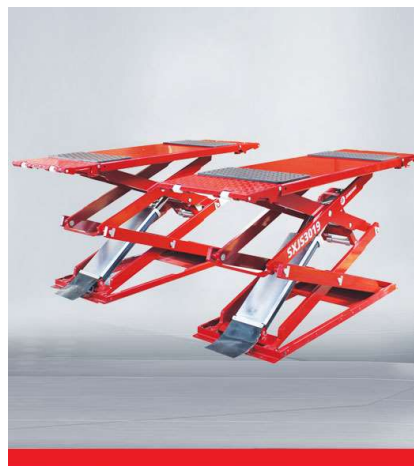
SXJS3019 Ultra-thin Small Scissor Lift