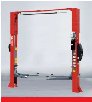
QJ-Y-2-45KC TTwo-post Clear floor Lift (Electric Unlocking)