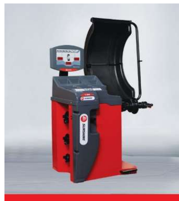
Wheel Balancer S-868