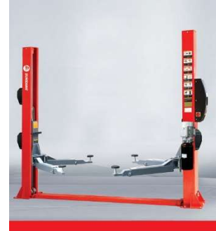
QJ-Y-2-40B Two-post Lift(Electric Unlocking)

S2-45 KC Elevador 2 Colunas sem base cap. 4500 Kg