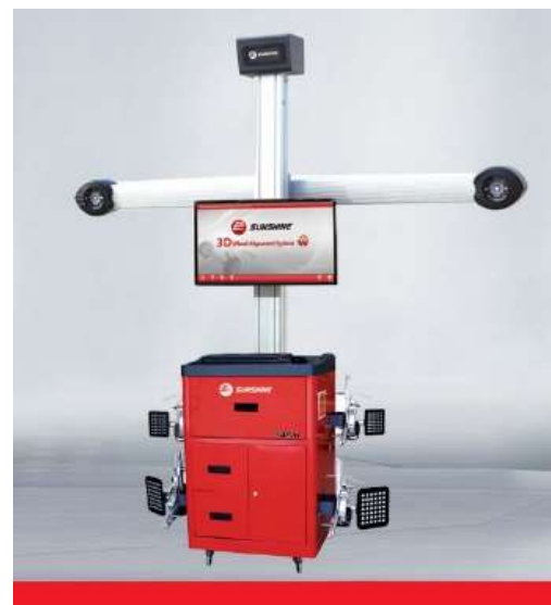
3D Series SP-G6T