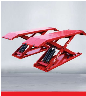
Mid-rise Ultra-thin small scissor lift