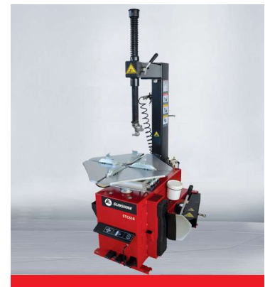
Tire changer STC-658

STC888 Maquina Desmontar Pneus Automática 9- 22" / 12" – 26"