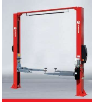
QJ-Y-2-45C Two-post Clear floor Lift (Electric Unlocking)