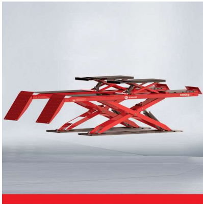
QJY-J-55 Ultra-thin Alignment scissor lift