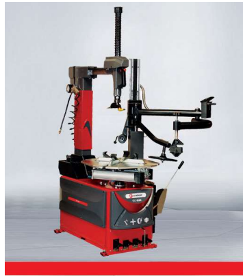
Tire changer STC-868R