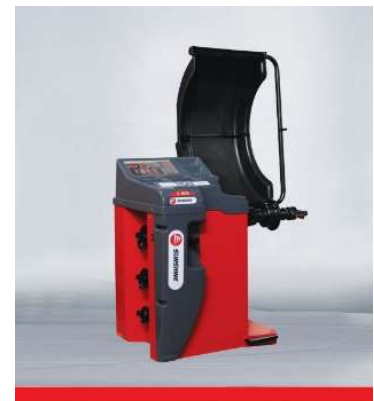
Wheel Balancer S-808

S909 Maquina Equilibrar Rodas 12" – 30" Monitor 3D system