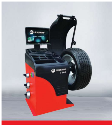
Wheel Balancer-3D Monitor S-909

STC 658 Maquina Desmontar Pneus Semi Automática 11" – 24"