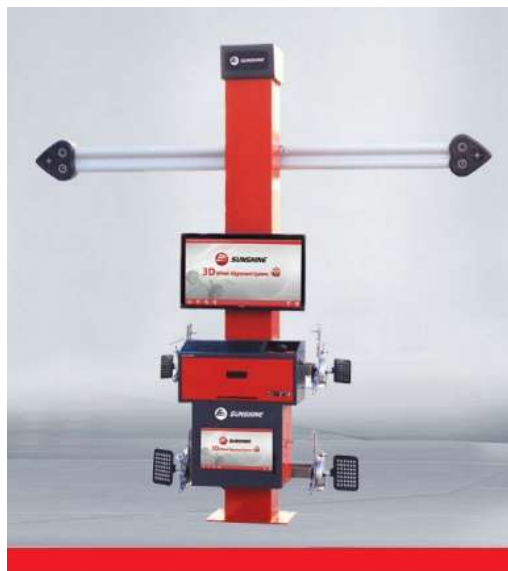
3D Series S -F9