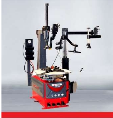
Tire changer STC-888